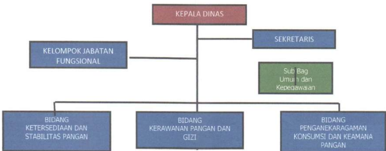
Gambar 1. Bagan Susunan Organisasi Dinas Ketahanan Pangan (Lampiran PERGUB No. 48 Tahun 2022)